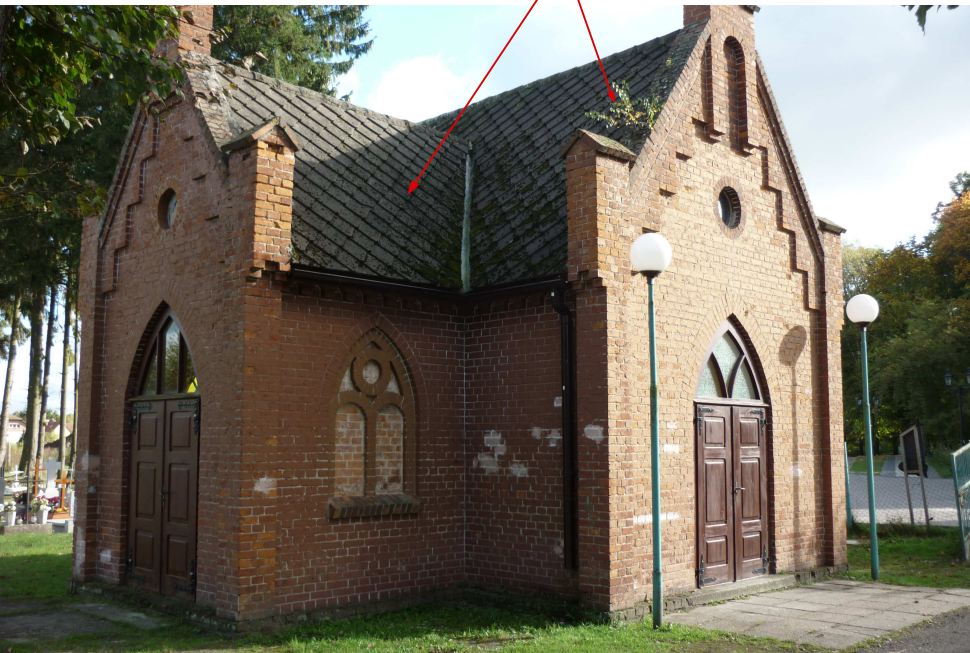
ELEWACJA PÓŁNOCNO - ZACHODNIA