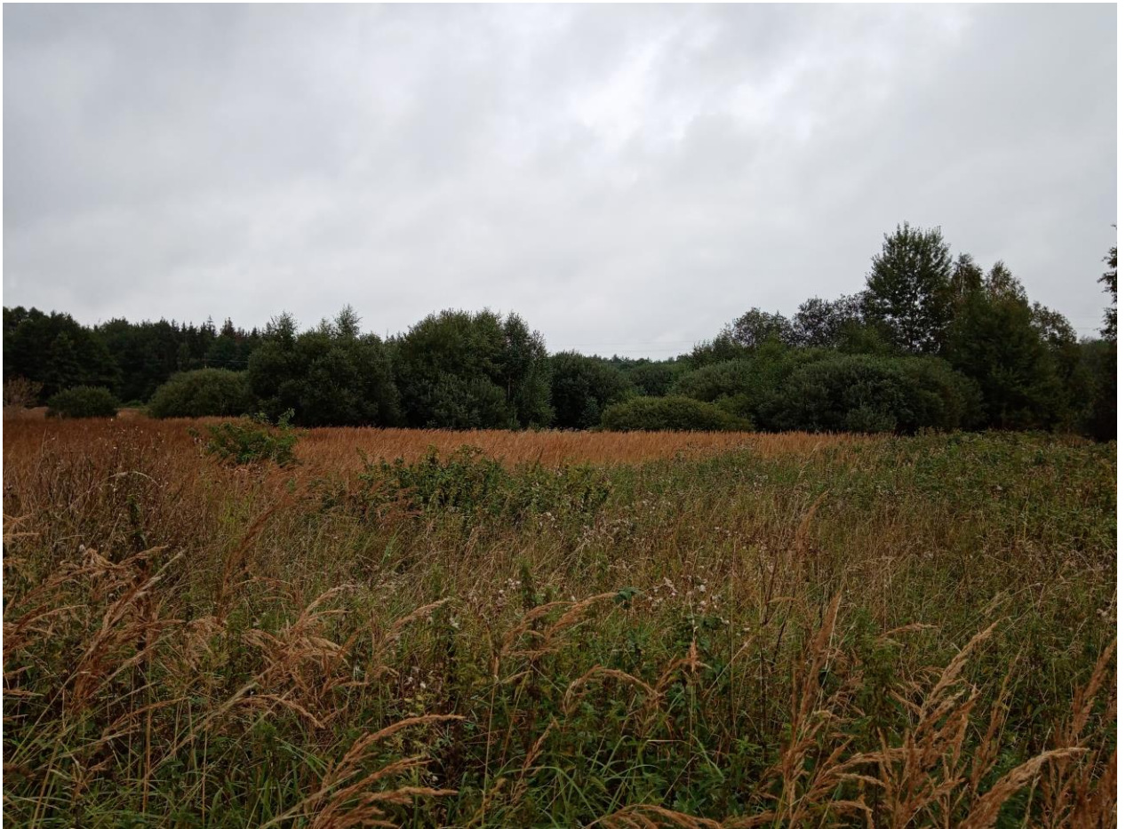
Fot. 3. Centralna część terenu, w tle skupiska zakrzewień.