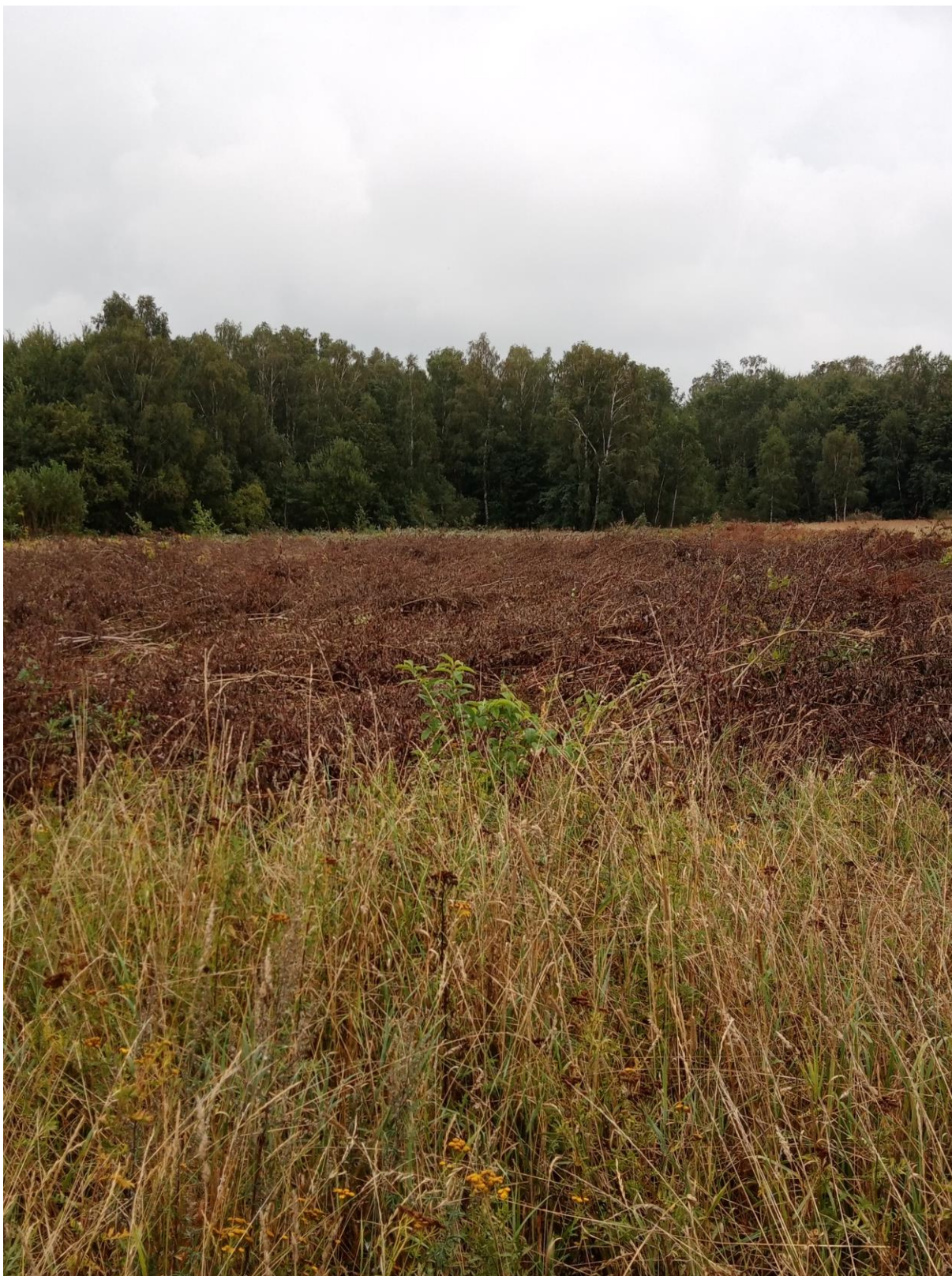
Fot. 5. Wycięte samosiewy w części centralnej terenu, w tle linia lasu w części południowej.