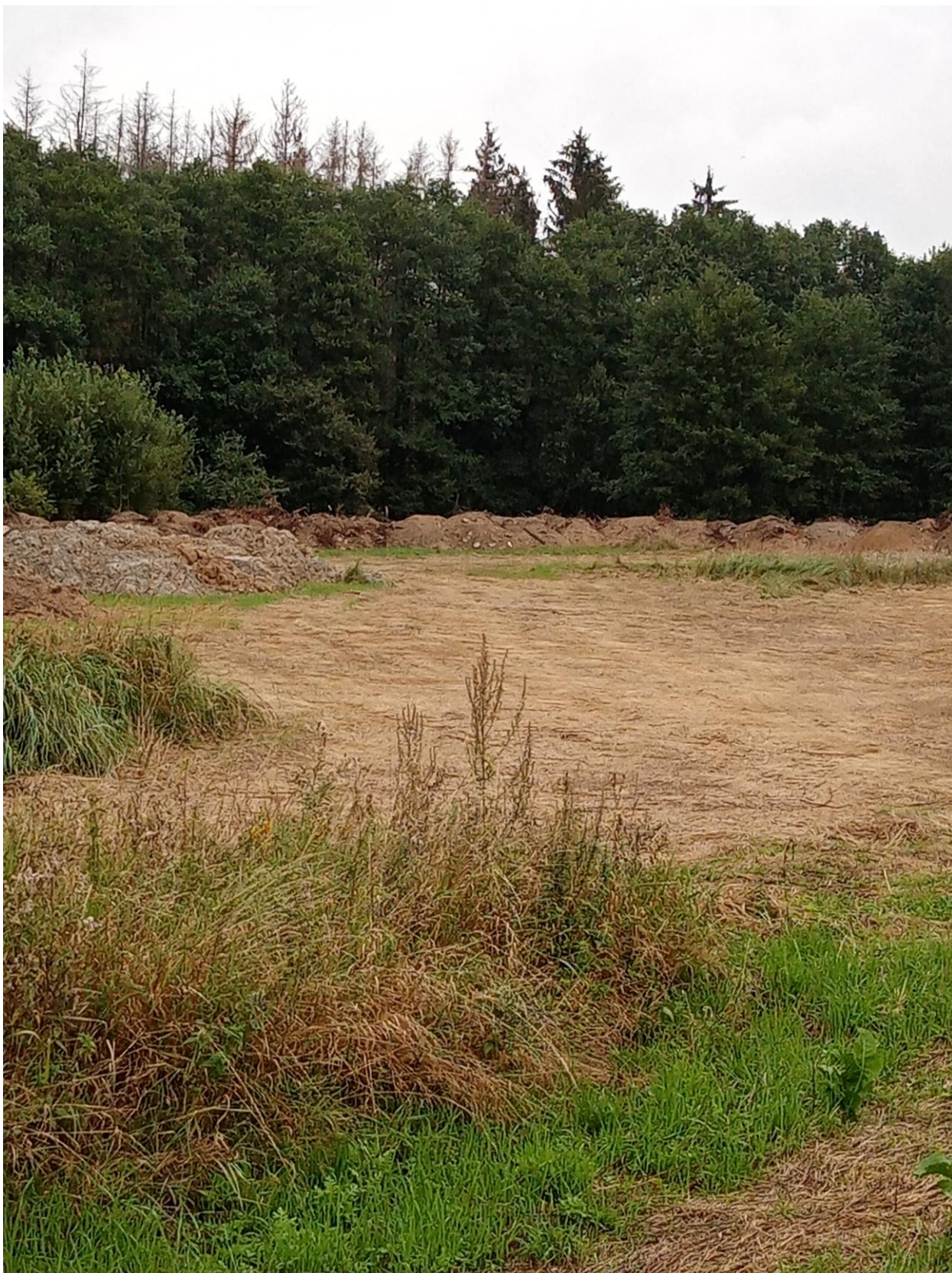
Fot. 2. Hałdy odpadów ziemnych w centralnej części terenu, w tle linia lasu.