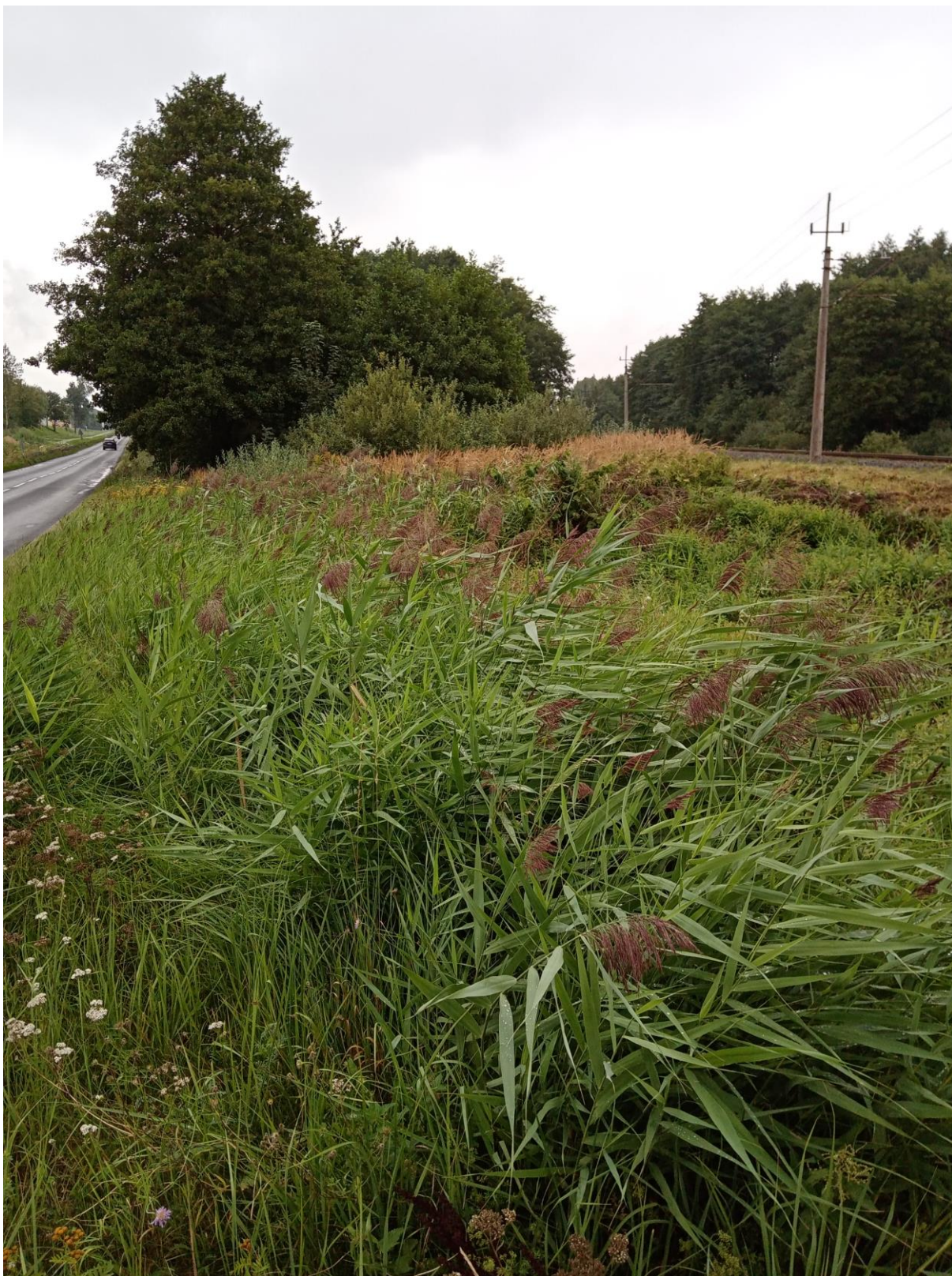
Fot. 4. Skrajny południowy fragment terenu ograniczony drogą wojewódzką i linią kolejową.