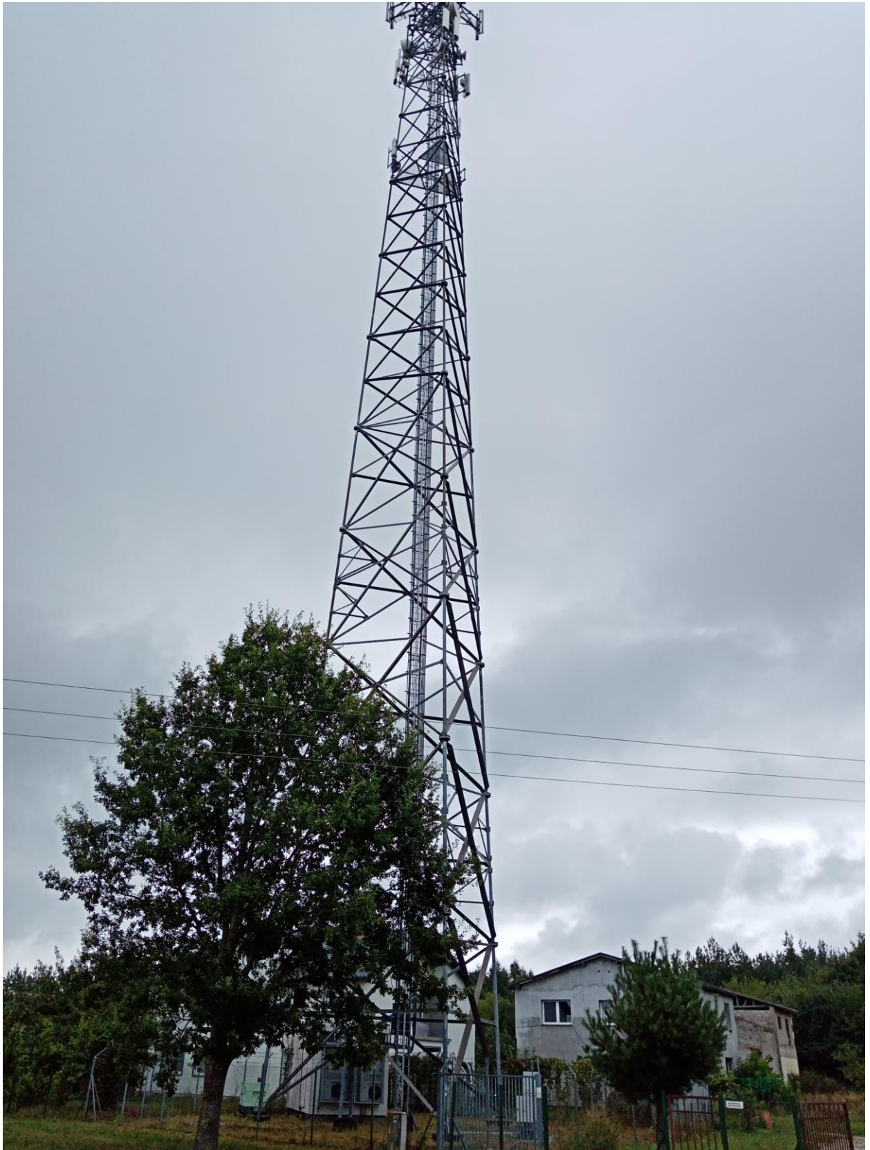
Fot. 1. Zabudowania oraz maszt telefonii cyfrowej w północnej części terenu.